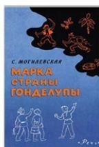
Марка страны Гонделупы Софья Могилевская СПб.: Речь, 2015