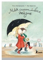
Моя счастливая жизнь Русе Лагеркранц М.: КомпасГид, 2014