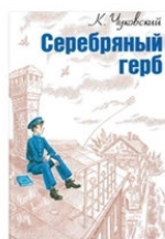
Серебряный герб Корней Чуковский М.: Энас-книга, 2018

Эти книги вы можете взять на старшем абонементе.