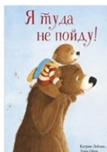
Я туда не пойду Катрин Леблан СПб.: Поляндрия, 2020

Эти книги вы можете взять на младшем абонементе.