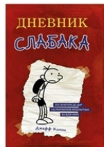
Дневник слабака Джефф Кинни М.: АСТ, 2018