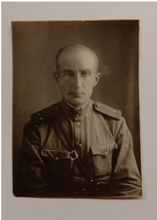
Фотография 2 :